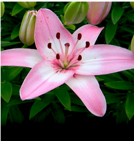
LILIA – LILY /lili/