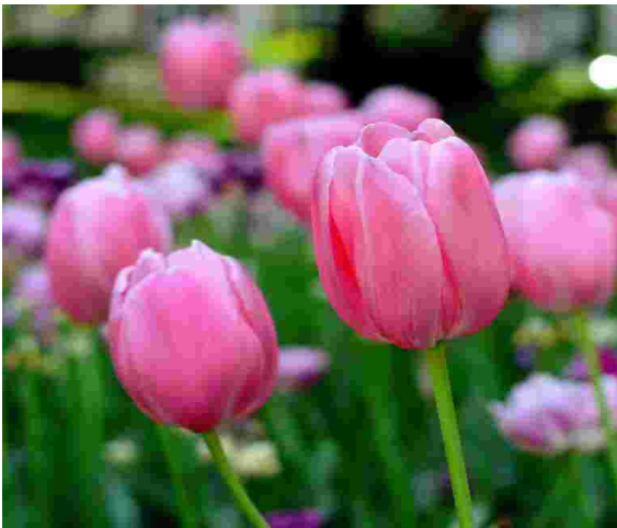
TULIPAN – TULIP /tjulip/