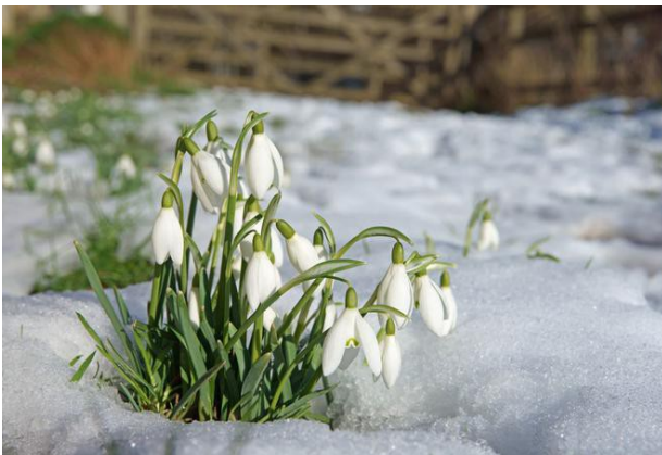
PRZEBIŚNIEG – SNOWDROP /snołdrop/

Teraz czas odwiedzić świnkę Peppę i poznać jej kolejne przygody. :) Tym razem świnka Peppa i jej brat George sadzą kwiatki w ogródku. To co ? Obejrzyjmy :)