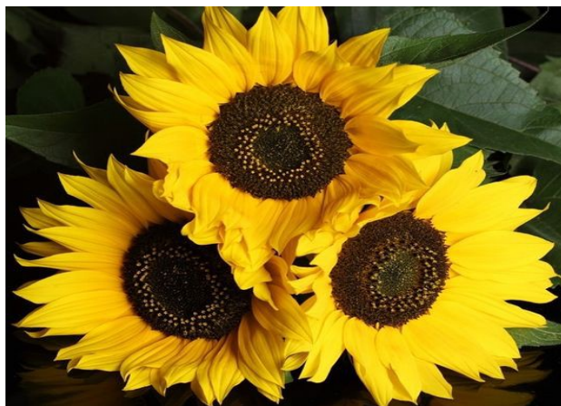
SŁONECZNIK – SUNFLOWER /sanflaer/