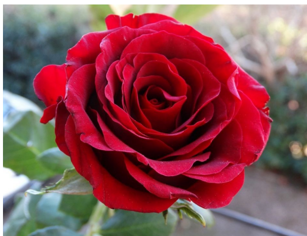
RÓŻA – ROSE /rołz/