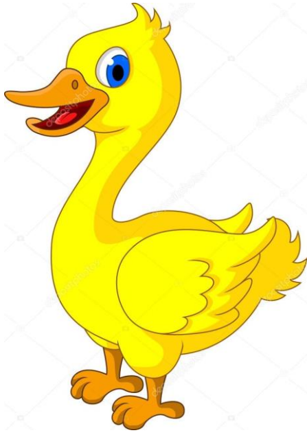
KACZKA – DUCK /DAK/