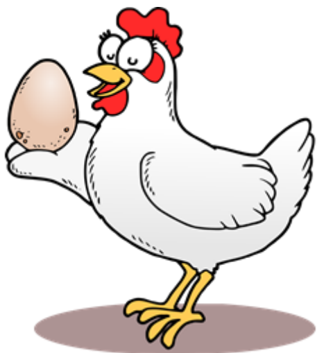
KURA - HEN /HEN/