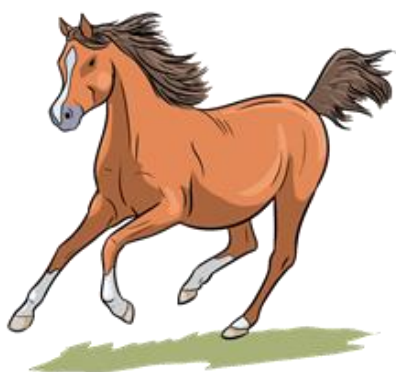
KOŃ – HORSE /HORS/