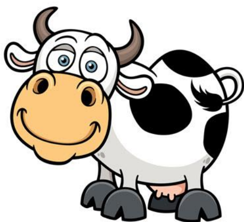
KROWA – COW /KAL/