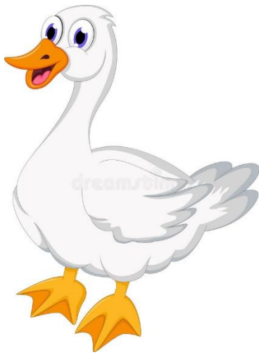
GEŚ – GOOSE /GUS/