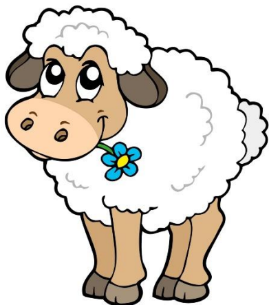
OWCA – SHEEP /SHIP/