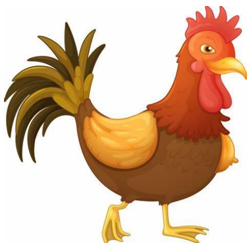
KOGUT – ROOSTER /RUSTER/