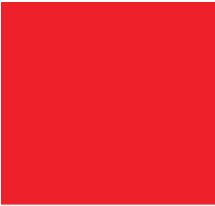
Kwadrat – SQUARE /skler/