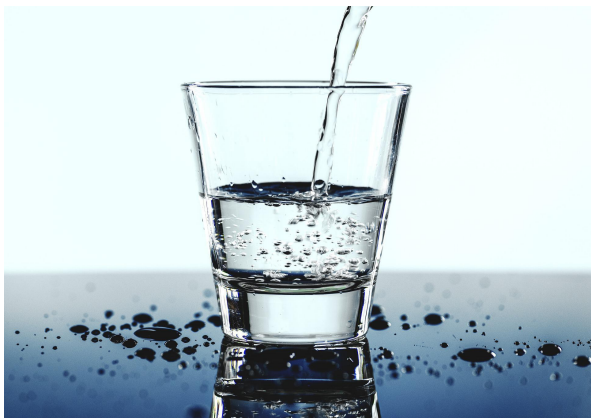
Woda -WATER / loter /