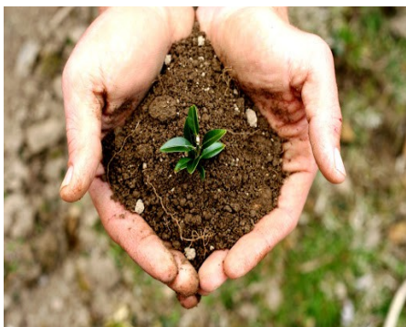
Ziemia – EARTH / erf /