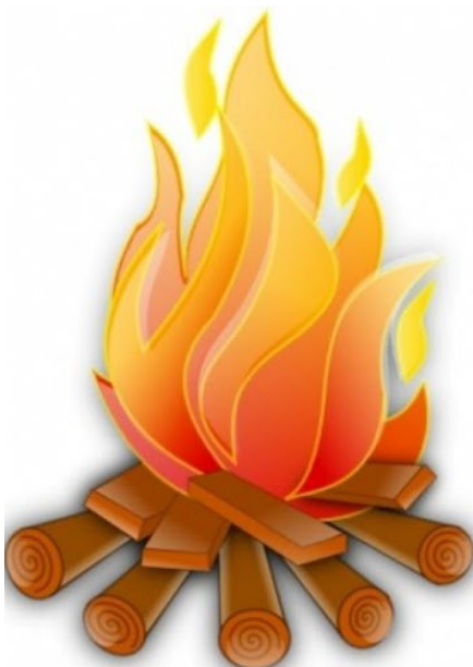
Ogień -FIRE / fajer /